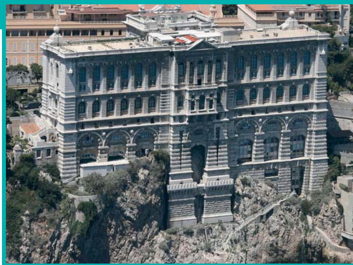
Le Musée Océanographique

Cette année, dans le cadre du Festival de Littérature Genèse, projet annuel intégrant des activités