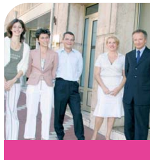
Focus sur le Centre de Gérontologie