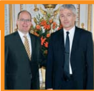
L'Ambassadeur de la République de Lettonie est un des derniers Ambassadeurs accrédités, le 12 mars 2009.

L'intéressé doit impérativement avoir le rang d'Ambassadeur pour que sa demande puisse être instruite. Si tel est le cas, le Département des Relations Extérieures, destinataire de la note, saisit le Cabinet Princier pour obtenir de S.A.S. le Prince Souverain son agrément préalable à la fois sur l'établissement de relations diplomatiques, avec échange d'Ambassadeurs et sur la nomination de l'Ambassadeur.