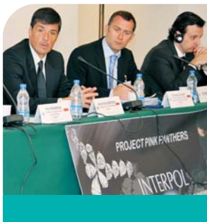
Interpol et Europol à Monaco

Les résultats de l'enquête interne "Votre avis nous intéresse" dans ce numéro du JDA.