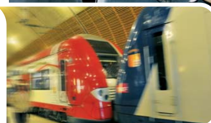
Le 19 septembre SAS le Prince Albert II et Jean-Louis Borloo ont inauguré la première rame de TER aux couleurs monégasques.