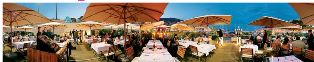
Un nouvel espace face au port Hercule