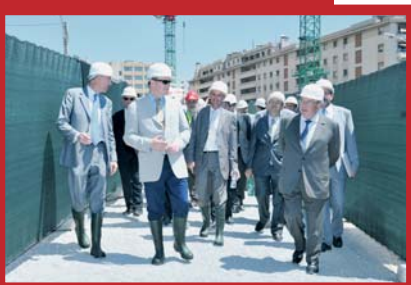
Visite du chantier du réseau routier souterrain par le Prince Albert II, le 23 juin dernier