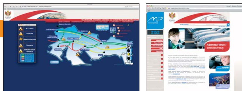
Les sites internet du centre de régulation du trafic et des parkings publics

ce qui peut avoir une incidence sur les déplacements en Principauté (accident, travaux, danger, manifestation...). La consultation de la carte principale est claire, et la navigation très simple. La rubrique Flash Info dresse la liste très précise des changements affectant plus durablement la circulation. La sécurité des tunnels fait l'objet d'une rubrique distincte et l'Espace Pro, accessible après identification, enregistre les demandes d'occupation de la voie publique pour les chantiers. 1000 connections avaient été enregistrées sur le nouveau site, deux mois après son lancement.