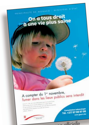
La campagne officielle

Elle donne enfin à la Direction du Travail les outils pour mener à bien ses missions de vérifications et d'arbitrage. Dans l'administration, 3 jeunes bénéficient depuis septembre 2008 de ces avantages : deux apprentis jardiniers au SDAU, issus du Centre de formation des métiers horticoles d'Antibes et un mécanicien au garage de la Sûreté Publique, venu de l'Institut de formation automobile de Nice. Ayant le statut de salariés, ils ont droit quand ils sont âgés de moins de 18 ans à une rémunération fixée à 50 % de l'indice de base de la Fonction Publique ; lorsqu'ils sont âgés de 18 ans et plus, ils perçoivent une rémunération correspondant à 75 % dudit indice. Du fait de l'allongement constant des études, tous les métiers sont ainsi concernés, du CAP à Bac+5, pour offrir aux jeunes cette indispensable immersion dans le monde du travail.