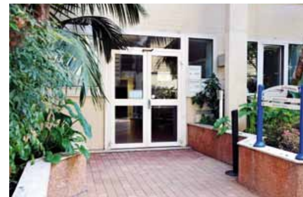
Les démarches spontanées sont aussi souvent productives. En effet, il n'est pas rare qu'un jeune puisse trouver un emploi saisonnier par ses propres moyens, fort de son implication et de sa motivation dans cette recherche d'emploi. Dans tous les cas, la Cellule Emploi-Jeunes conseille aussi les jeunes sur la rédaction du CV, la préparation des entretiens de recrutement, ou la sélection d'entreprises à démarcher.

Le Service de l'Emploi a identifié de nombreuses sociétés qui chaque été recrutent des jeunes. Le Service travaille donc en amont avec ces sociétés en leur proposant des candidatures, dès le début de la saison et au fur et à mesure des inscriptions des étudiants. Il s'agit de leur proposer des CV répondant aux besoins des entreprises tant en termes de profil que de disponibilité des candidats. « Nous travaillons aussi avec des sociétés qui n'ont pas forcément une activité saisonnière mais qui peuvent avoir un besoin de personnel ponctuel, notamment pour pallier l'absence de leurs salariés