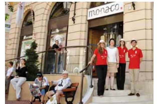
En 2014, au mois de juin les Britanniques étaient les plus nombreux, en juillet c'étaient les français et en août les Russes. Cette répartition est une des clés du succès de Monaco capable d'attirer des clientèles venant d'horizon divers et nous a permis de résister mieux que d'autres aux années de crise.

En terme d'accueil nous souhaitons que nos visiteurs repartent satisfaits et le fassent savoir à leur