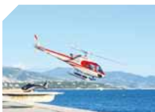
DEEU – Hélicoptère : chiffres record pendant le Grand Prix