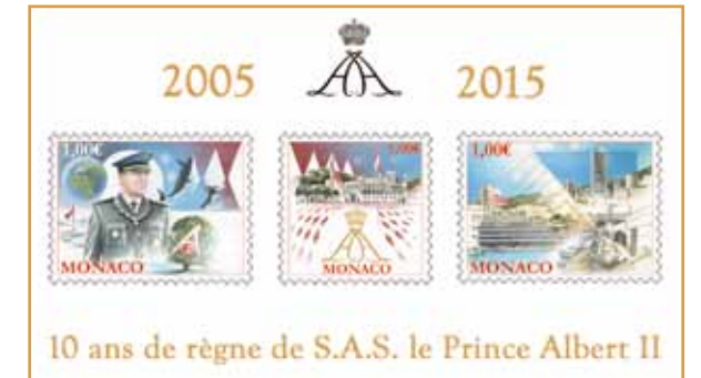
Renseignement : oetp@gouv.mc

Le bloc « 10 ans de règne du Prince Albert II » sera vendu exclusivement par l'Office des Emissions de Timbres-Poste, le Musée des Timbres et des Monnaies, et dans le réseau de vente de la Principauté. Cette émission sera proposée aux abonnés et clients, conjointement aux autres valeurs du programme philatélique de la deuxième partie 2015.