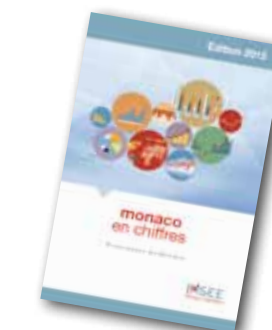
« Monaco en chiffres » est le résultat visible du travail de l'IMSEE tout au long de l'année et fruit de la collaboration avec les services et organismes fournisseurs des données.

Concernant l'économie, les principaux indicateurs sont globalement positifs pour l'année 2014. L'emploi a poursuivi sa croissance, le marché de l'immobilier a affiché un chiffre d'affaires record (plus de 2 milliards d'euros) et le volume des échanges commerciaux progresse également.