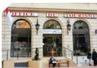
FIN – La DTC est prête pour l'été