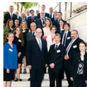
Le 10 juin 2015, SAS le Prince Albert II de Monaco a conclu cette réunion historique en Principauté à laquelle ont participé, pendant trois jours, des experts internationaux de la biodiversité et de l'Antarctique. « Je peux vous garantir que mon Gouvernement et ma Fondation feront tous les efforts possibles pour faire en sorte que la science continue à prévaloir sur ce territoire grâce à la coopération internationale. » a rappelé Son Altesse Sérénissime.

Les résultats et avancées de cette réunion de travail seront disponibles dans les prochains mois et feront office de base pour la stratégie visant à poursuivre l'amélioration de la conservation en Antarctique et dans l'Océan Austral.