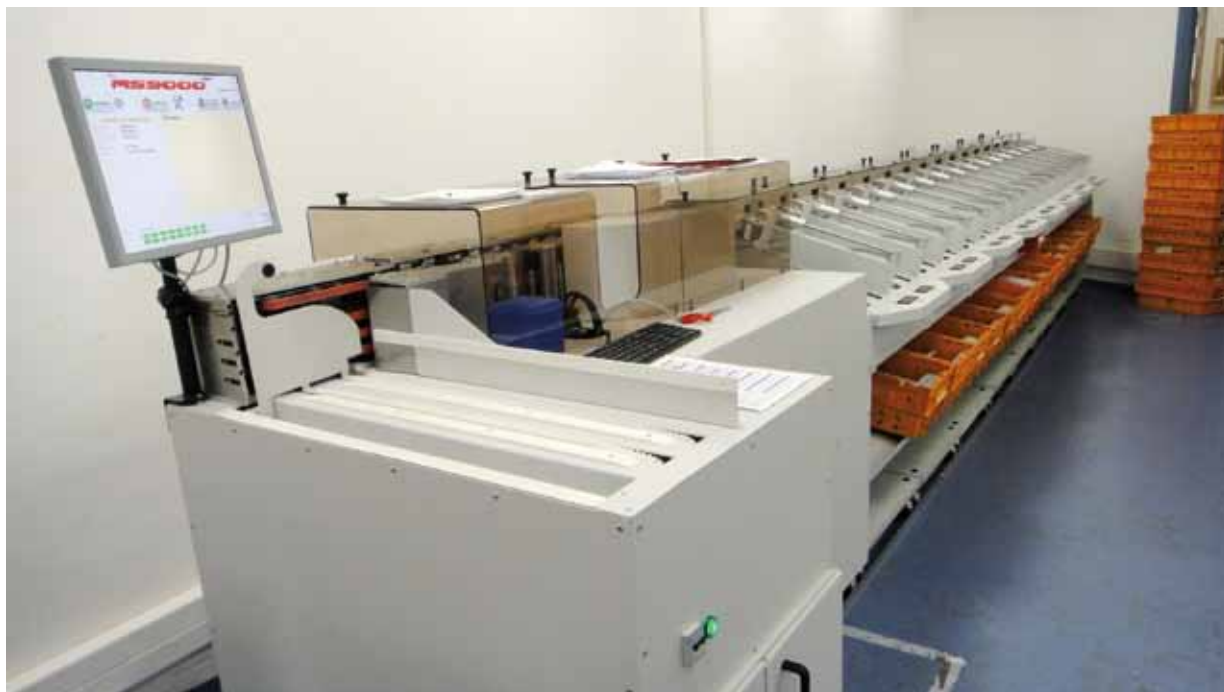
De plus, depuis 2 ans La Poste Monaco s'est équipée d'une machine de tri capable de trier le courrier par lecture graphique standardisée. En effet, cette machine est capable de trier automatiquement 30% du courrier Monaco-Monaco. Cette avancée technologique a su apporter un gain de temps et une simplification des tâches pour les facteurs.

La dernière réorganisation de la distribution du courrier de La Poste Monaco remonte à l'extension de Fontvieille. Depuis, de nombreux ajustements des tournées ont été apportés afin d'embrasser l'évolution de la gamme Courriers / Colis. Aujourd'hui, La Poste Monaco opère dans un souci de modernisation afin de s'adapter aux nouveaux modes de communication et de consommation des usagers. M. Jean-Luc Delcroix, Directeur de La Poste Monaco, nous en dit davantage.