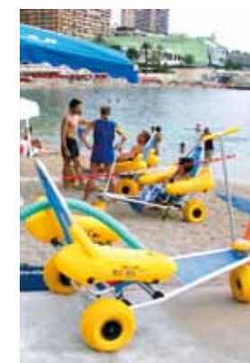
Les habitués et fidèles, d'une année sur l'autre, sont majoritaires. Cependant les demandes de « réservations » par des maisons de retraites ou organismes associatifs sont de plus en plus fréquentes.

Bénéficiant du label Handi-Plage niveau 3, le site est idéalement situé. En effet, sa proximité avec le poste de surveillance de baignades et les divers aménagements facilitant le cheminement pour les personnes en fauteuil par la jetée centrale, lui confère une localisation optimale. « Toutefois, l'accès au site s'avère nettement moins adapté pour les malvoyants ou non-voyants. Un point qui devrait être rapidement traité » conclue M. Galtier.