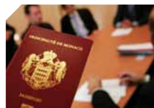
DREC – Conseils avant un séjour à l'étranger