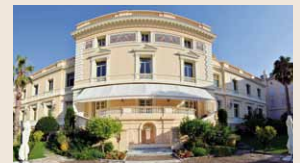
Le Conseil de Gouvernement se déroule à la Résidence du Ministre d'État

Sont, par exemple, concernées les autorisations de Sociétés et de commerces ainsi que les modifications de commerces et les modifications de statuts.