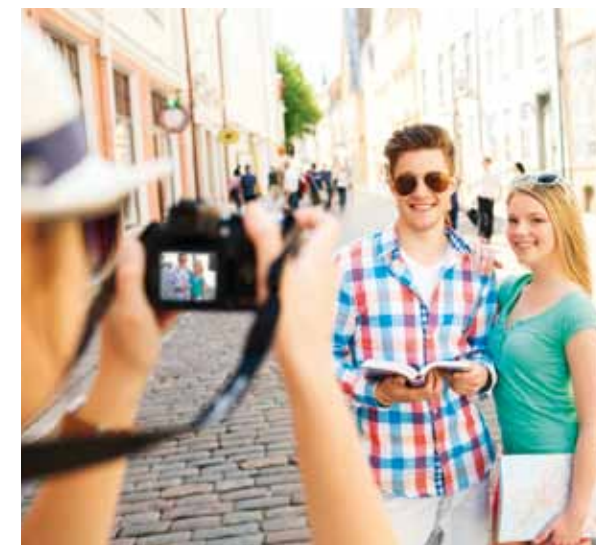
Tous les résidents monégasques bénéficiant d'une carte de séjour délivrée par la Principauté, peuvent circuler en toute régularité dans l'espace Schengen. Ainsi la possession d'un passeport n'est donc pas nécessaire pour le titulaire.

En revanche, pour tout voyage touristique hors espace Schengen, le Gouvernement Princier conseille à ses résidents étrangers de vérifier les formalités d'entrée et de séjour auprès de l'ambassade et du consulat du pays de destination.