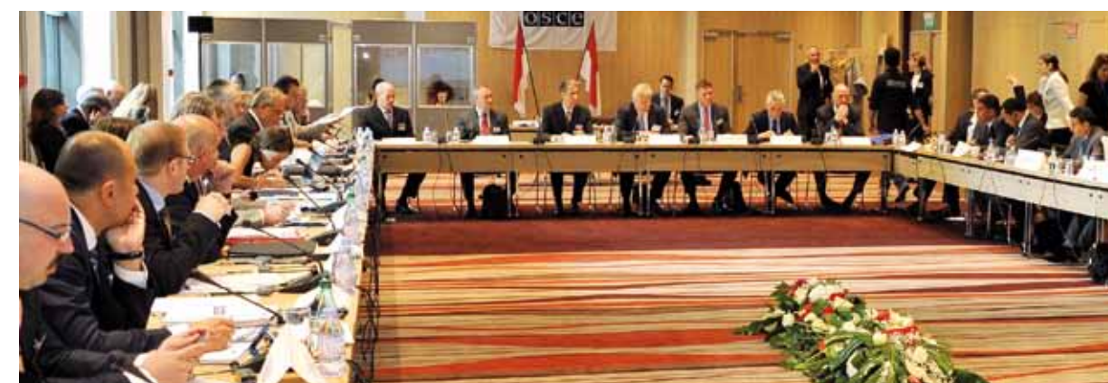
Le Gouvernement Princier maintiendra, en 2015, son soutien au développement de la dimension méditerranéenne de l'OSCE, en finançant un atelier de formation et de sensibilisation à la féminisation des flux migratoires liés au travail qui sera organisé à Malte et s'adressera à toute la région méditerranéenne.

annuellement l'OSCE et ses six voisins de la rive Sud de la Méditerranée, sur la thématique du « renforcement du rôle des femmes dans la vie publique, politique et économique ». Puis, en novembre 2014, la Principauté avait accueilli la 83 e Assemblée Générale d'INTERPOL.