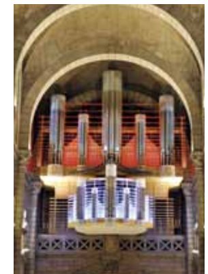
Pour le Festival d'orgue ce sont sur un mois et demi : 8 concerts, 9 artistes internationaux invités, environ 2400 spectateurs attendus. 10 e Festival International d'Orgue de Monaco : du 28 juin au 16 août à 17h en la Cathédrale de Monaco, www.festivalorguemonaco.com

partager notre aventure et de recueillir sa jubilation », souligne le Directeur des Affaires Culturelles.