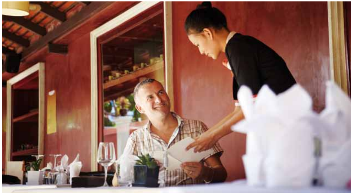
Les principaux secteurs pourvoyeurs d'emplois saisonniers restent les sociétés dont l'activité est liée au tourisme, au commerce, à la restauration et l'hôtellerie. Quelques sociétés du secteur tertiaire comme les banques, offrent également des emplois saisonniers.