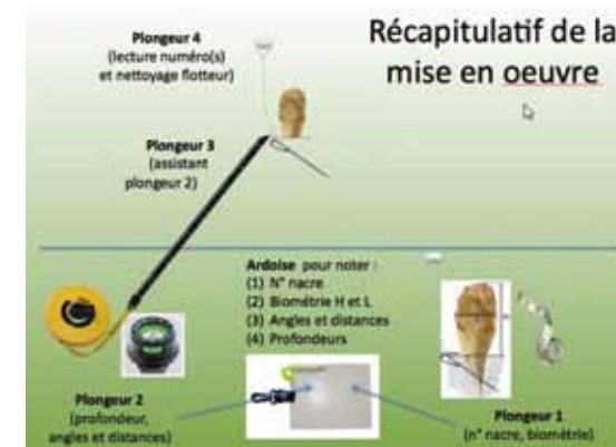
Les informations récoltées lors de cette journée vont compléter les données acquises depuis 2007 par la Direction de l'Environnement sur la dynamique d'évolution de ce peuplement en Principauté.

Dimanche 7 juin, les plongeurs de la Principauté se sont mobilisés pour la grande nacre Pina Nobilis . Deuxième plus grand mollusque du monde après le bénitier, elle peut atteindre 1,20 m de hauteur et vivre une dizaine d'années. Cet animal filtreur est sensible