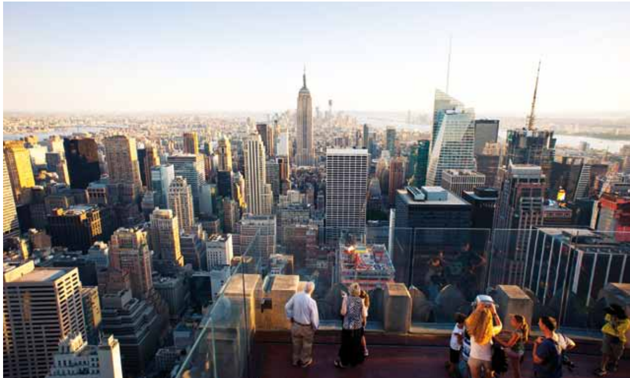
Les États-Unis d'Amérique ont mis en place une nouvelle réglementation relative à la procédure de demande de visa. Conformément à cette réglementation et depuis le 1er octobre 2006, les services consulaires américains chargés d'établir les visas ne sont autorisés à n'accepter que les demandes établies sur le formulaire électronique DS-156 (Electronic Visa Application Form - EVAF). Ce formulaire est disponible sur le site de l'Ambassade des États-Unis.

Qu'ils soient juilletistes ou aoutiens, les fonctionnaires et agents de l'Etat vont bientôt partir en vacances. Si certains resteront en Principauté et flâneront, d'autres partiront à l'étranger. Afin d'éviter les mauvaises surprises, voici quelques conseils à suivre.