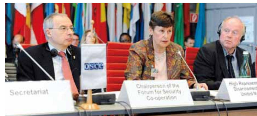
Cet événement s'inscrit dans la continuité de deux Conférences, tenues respectivement à Vienne en 2013 et à Istanbul en 2014, dont l'objectif était d'évoquer les défis liés au traçage des armes légères et de petit calibre (ALPC) illicites et des thématiques d'actualité ayant trait à la sécurité d'une manière plus générale.

Lundi 1 er et mardi 2 juin, la Principauté a accueilli une Conférence conjointe réunissant l'OSCE, INTERPOL et l'ONU DC, dont le thème général était « la lutte contre les menaces transnationales émergentes dans la région méditerranéenne à travers le partage d'information et la coopération ».