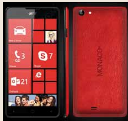
Le Windows phone Monaco 47 a été commercialisé lors des fêtes de fin d'année 2014. Les ventes ont été de 5.000 unités, principalement dans les Microsoft store aux Etats-Unis.

Pour mémoire, Avenir Telecom a travaillé conjointement avec Monaco Brands pour annoncer lors du Mobile World Congress à Barcelone début mars 2015 le lancement prochain du Monte-Carlo 50 sous Android. Ce nouveau produit a également été présenté lors du salon du MEDPI à Monaco en mai dernier.