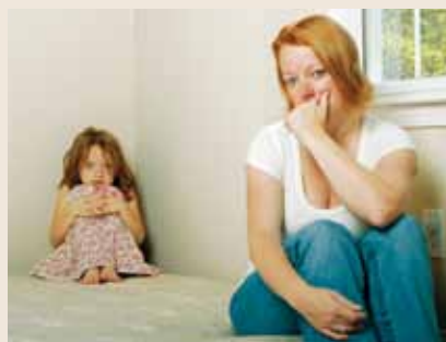
La division est chargée du versement des aides financières ponctuelles allouées après une enquête sociale effectuée par les Assistantes Sociales de la Division Action Sociale.