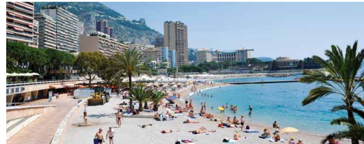
Pour la saison 2015, le site Handi-Plage est ouvert de 10h à 17h00, du 1er juillet au 6 septembre et animé par 4 handiplagistes.

Depuis neuf années, la Direction de l'Action Sanitaire et Sociale (DASS) est en charge du site Handi-Plage situé sur la plage du Larvotto. Véritable lieu d'échanges, le site Handi-Plage permet aux personnes handicapées et à mobilité réduite de pouvoir se baigner en mer en toute sécurité et tout confort.