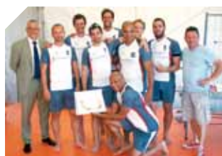
ME – Les résultats des équipes sportives de la Fonction Publique

Ce mois-ci, le JDA vous propose de découvrir les missions de la Direction de l'Environnement, qui englobent notamment la gestion de la faune et la flore marine de la Principauté. Exemple concret avec le recensement des grandes nacres dans la réserve du Larvotto (rendez-vous en page 19).