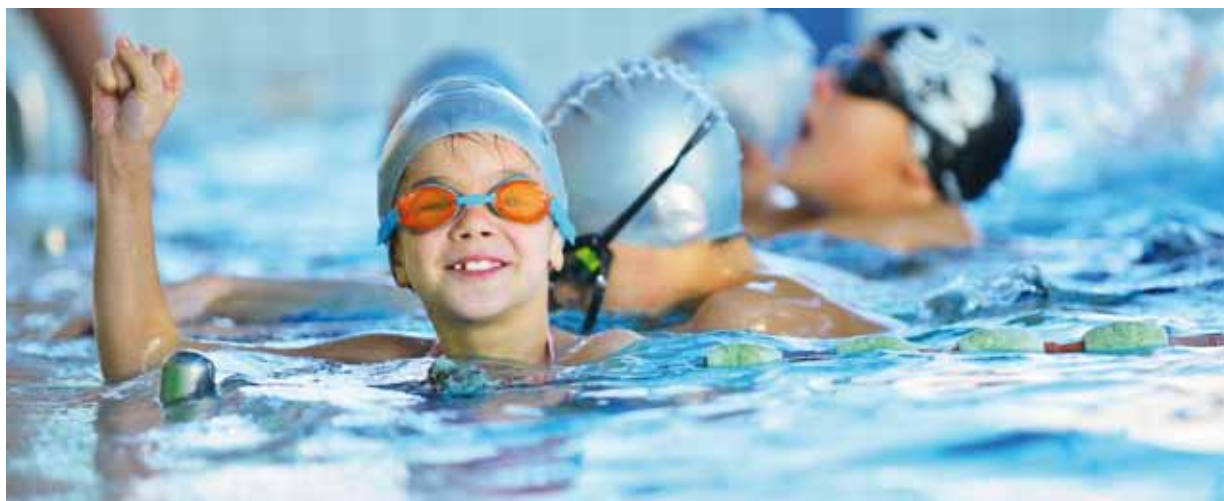
Afin de donner la possibilité aux jeunes des associations sportives monégasques de concilier la pratique intensive de leur discipline tout en poursuivant un parcours scolaire de qualité, la DENJS a mis en place un dispositif de classes à horaires aménagés pour les élèves qui pratiquent un sport à haut niveau. La Cellule Sport est donc chargée de l'étude et du suivi de ces demandes.

Depuis un an, la Direction de l'Éducation Nationale de la Jeunesse et des Sports (DENJS) peut compter sur deux nouvelles recrues qui sont chargées d'assurer la bonne gestion du sport en Principauté. Le JDA vous propose de découvrir les missions et les objectifs de cette cellule.