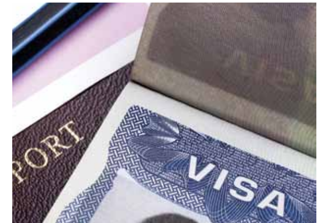
Aucun visa n'est exigé pour l'entrée aux U.S.A et dans les 25 pays de l'Espace SCHENGEN, à savoir l'Allemagne, l'Autriche, la Belgique, le Danemark, l'Espagne, l'Estonie, la Finlande, la France, la Grèce, la Hongrie, l'Islande, l'Italie, la Lettonie, la Lituanie, le Luxembourg, Malte, la Norvège, les Pays-Bas, la Pologne, le Portugal, la République Tchèque, la Slovaquie, la Slovénie, la Suède et la Suisse.

Pour plus de renseignements, le JDA vous invite à vous rendre sur le portail du Gouvernement, dans l'onglet « Action Gouvernementale » puis dans la rubrique « Monaco à l'International ». Vous y trouverez le lien vers le « Conseil aux voyageurs ».