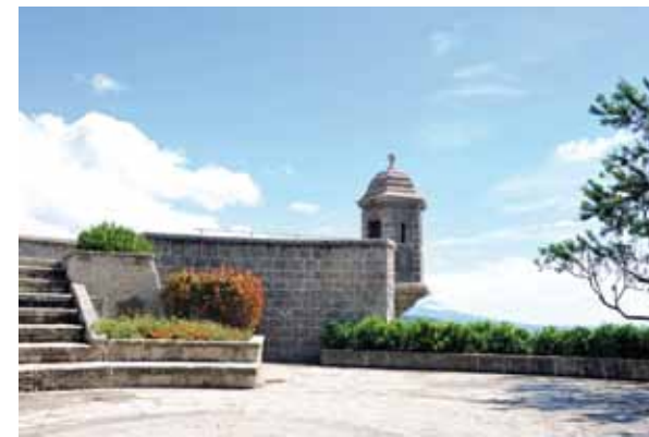
Pour le Théâtre du Fort Antoine ce sont sur un mois et demi : 7 spectacles, 7 compagnies invitées, environ 2500 spectateurs attendus. 45 e édition du Théâtre du Fort Antoine : du 6 juillet au 17 août au Théâtre du Fort Antoine, www.theatrefortantoine.com