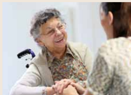
La Division Aide Sociale prend également en charge les prestations d'autonomie en faveur des personnes âgées à domicile et en établissement

La Division « Aide Sociale » c'est près de 3.000 interventions financières au cours de l'année :